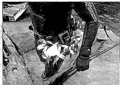
Norjalaisoturin kalansaalis kulkee rantaan vyötäisillä.