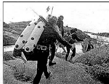
Merelle otetaan mukaan turvapallo, joka kertoo sukeltajan sijainnin esimerkiksi veneilijöille.