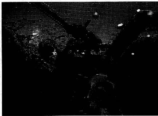
”Kalaa jää Suomenlahteen järkyttäviä määriä.”

soveltaa tietoa käytäntöön. Silloin voi aina ennustella, missä kalat todennäköisesti ovat”, Jukka Rapo sanoo. Suojaväriinsä luottavan hauen löytää useimmiten piileksimästä kaislikosta, josta se tosin lähtee liukkaasti karkuun, jos sukeltaja ei malta liikkua tarpeeksi rauhallisesti. Ahvenet taas ovat uteliaita ja uivat kohti kalastajaa.